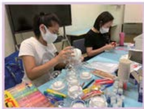
守護大使 - 婦女義工，製作閃亮冷靜瓶材料包

由社會福利署 2022-2023 守護大使計劃贊助，童•你看繪本-10-12月的4個免費網上活動，經已完滿結束。小朋友和家長透過製作冷靜瓶、種植農場手工、腦筋急轉彎之舒壓運動，認識不同情緒，學習如何表達情緒及放鬆心情。每個參加者都很投入活動，樂在其中。除小朋友玩得開心之外，更重要是能提升家長對兒童精神健康問題的認識及關注度，建立良好的親子關係。